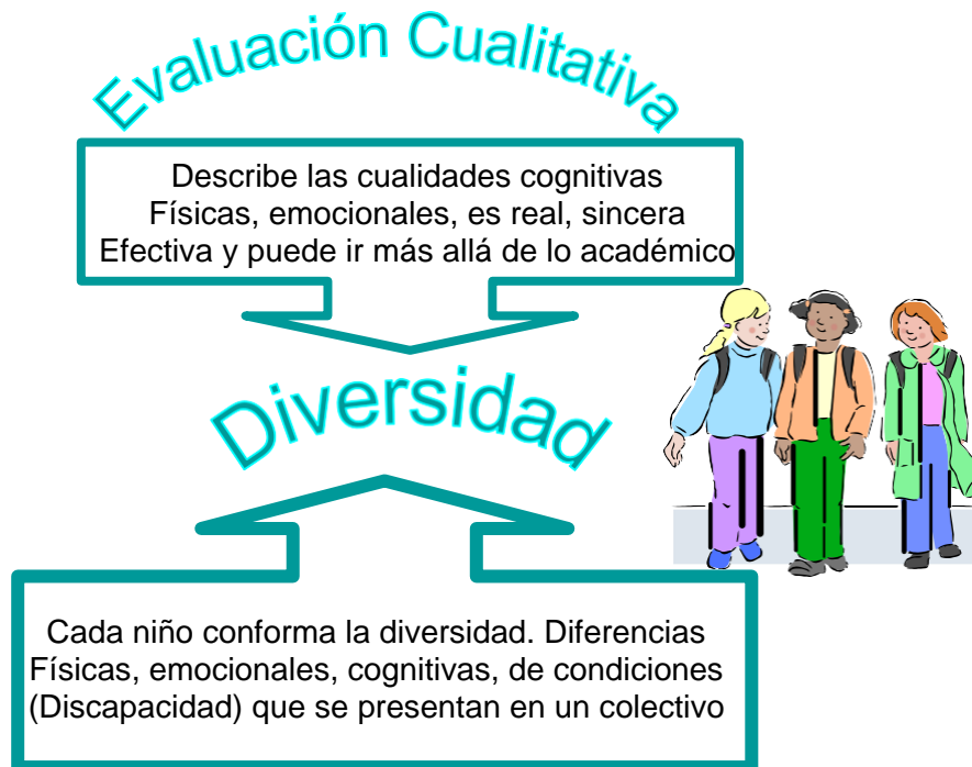
Diagrama Nº 1. Conceptos de evaluación y diversidad

Para los docentes la diversidad está conformada por aquella variedad de diferencias individuales, bien sean físicas, cognitivas, afectivas, culturales y religiosas donde cada niño representa esa diversidad, y la escuela es a su vez es la gran diversidad, diferencian igualmente aquellos niños con diversidad de condiciones como aquellos que han sido integrados y tienen una discapacidad bien sea cognitiva, visual o motriz catalogándolos en alguno de los casos como niños enfermos, esta concepción es errónea y surge como consecuencia de la falta de actualización y formación permanente de los docentes ante esta temática, limitando el verdadero proceso de integración y aceptación de estos niños en las escuelas regulares.